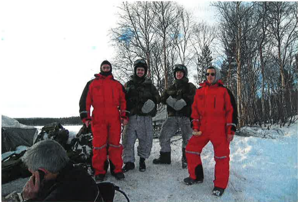
► El equipo de 'Chiloe', junto a una patrulla de montaña en Noruega.