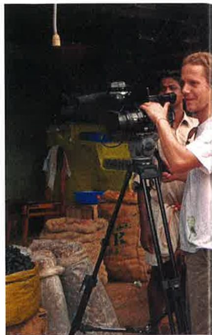
► Curiosos y un cámara en India.