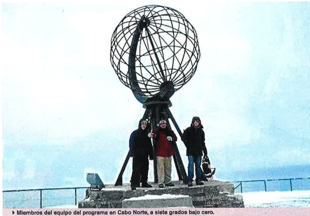
► Miembros del equipo del programa en Cabo Norte, a siete grados bajo cero.